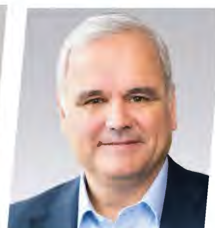
Stefan Oelrich Pharmaceuticals